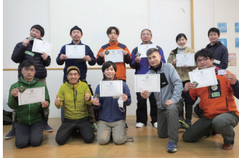
北海道体験観光推進協議会招致による開催

知事が認定する「アウトドアガイド資格制度」をアドベンチャーツーリズム（下記参照）への対応を背景に大幅に見直す方向で検討。